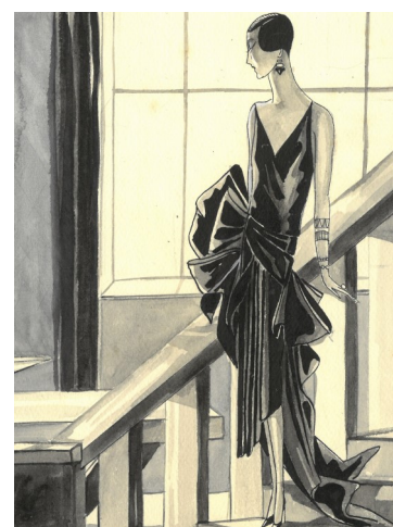
Archives Pierronne Guibert, dessins de mode, vers 1925