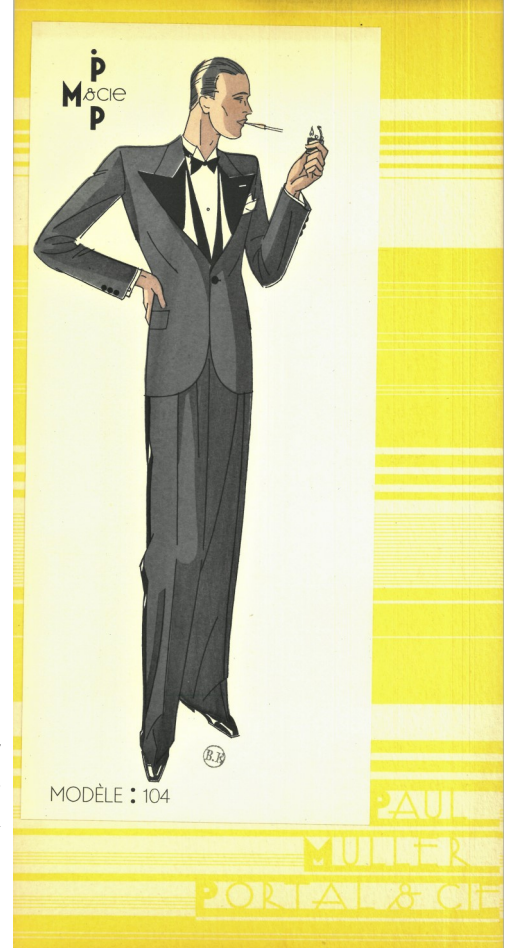
Paul Muller Portal et Cie, Nîmes... Hiver 1931