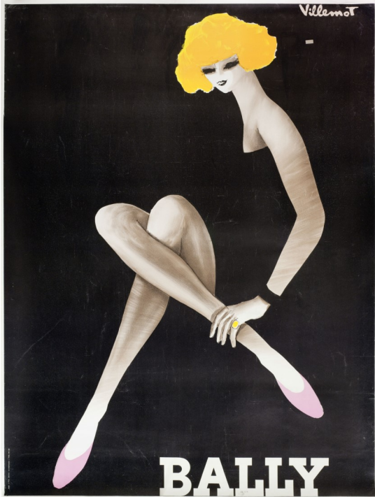
Bally [la femme en noir] Bernard Villemot 1982