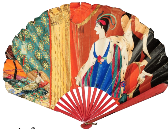
Éventail publicitaire Simonini's Restaurant Paul Iribe (illustrateur), Duvelleroy (éventailiste)