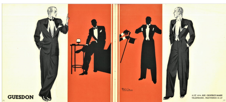
Une seule maison, habillez-vous richement, Guesdon Vers 1940, Illustré par Hemjic