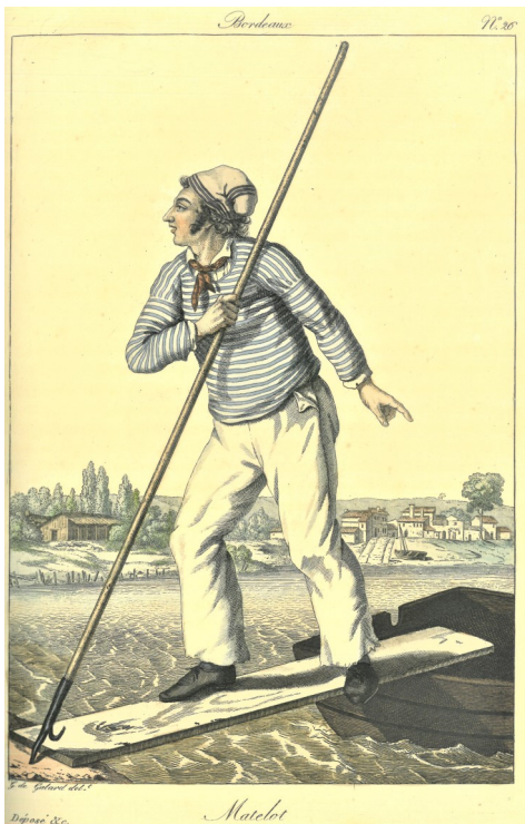
Recueil des divers costumes des habitants de Bordeaux..., P.-G. de Galard, vers 1819