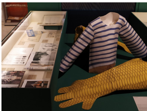
Créations des étudiants du DNMADE collection (vêtements et accessoires)

Pour l'ouverture du parcours découverte lors des journées du Patrimoine, les étudiants de la mention collection vêtements et accessoires se sont livrés à un « sprint créatif » de dix jours qui met en lumière leurs méthodes d'investigation. Parmi les documents issus des fonds de collections patrimoniales de la bibliothèque Forney, ils ont choisi une pièce maîtresse qui deviendra la pierre angulaire de leur collection à venir. Cette invitation à exposer dans deux des salles d'exposition de la bibliothèque leur donne l'opportunité d'interroger les temporalités de la mode : les filiations, les affects, les actualités ou la désuétude des objets qui jalonnent l'histoire de la mode.